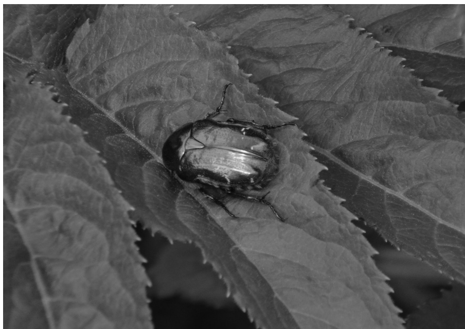
2. ábra: Az aranyos virágbogár ( Cetonia aurata ) kedveli a rózsafélék virágait. Fig. 2. The rose chafer ( Cetonia aurata ) likes the flowers of rosacea.

összetett szerv, amelyik szív és mozog is egyben, mint egy tömlőcske összehajtható. A bogarak ( Coleoptera ) rágói nemcsak a feldarabolást szolgálják, hanem a nektárcseppek lenyalogatását is a porzókról (2. ábra). Kétségtelenül a növény-rovar kapcsolatot a legtökéletesebben a poszméhek, méhek, darazsak mutatják, vagyis a hártýásszárnyúak ( Hymenoptera ) szájszervei és kosárcái. A kosárcák a méhek hátsó lábain levő mélyedések, amelyekbe a méh belesodorja a pollent. Ezt beviszi a fészekbe, a kaptárba. Vannak olyan virágszerkezetek (pl. az orchideák vagy kosborok), amelyek valósággal csábítják a hím dongókat. A virág alakja messziről olyan mintha egy nőstény dongó lenne. A párzani akaró hím, amint rászáll a növényre, elvégzi a beporzást. Egy-egy földi poszméh ( Bombus terrestris ) több mint 1000 virágot is beporozhat egy perc alatt (Móczár 1990).